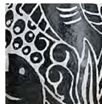
ÉMAIL ET MÉTAL (CAZAUX)