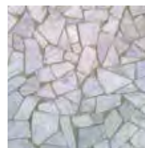
MOSAÏQUE DE MARBRE (PALLADIANA)