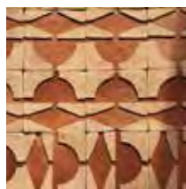
TERRE CUITE (FORNACE BRIONI)