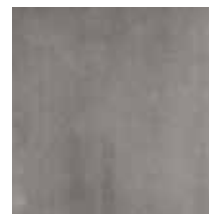
PANNEAU ASPECT BÉTON (VIVA BOARD)